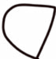
Mànigues 2 peces