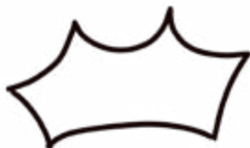
Corona 1 peça